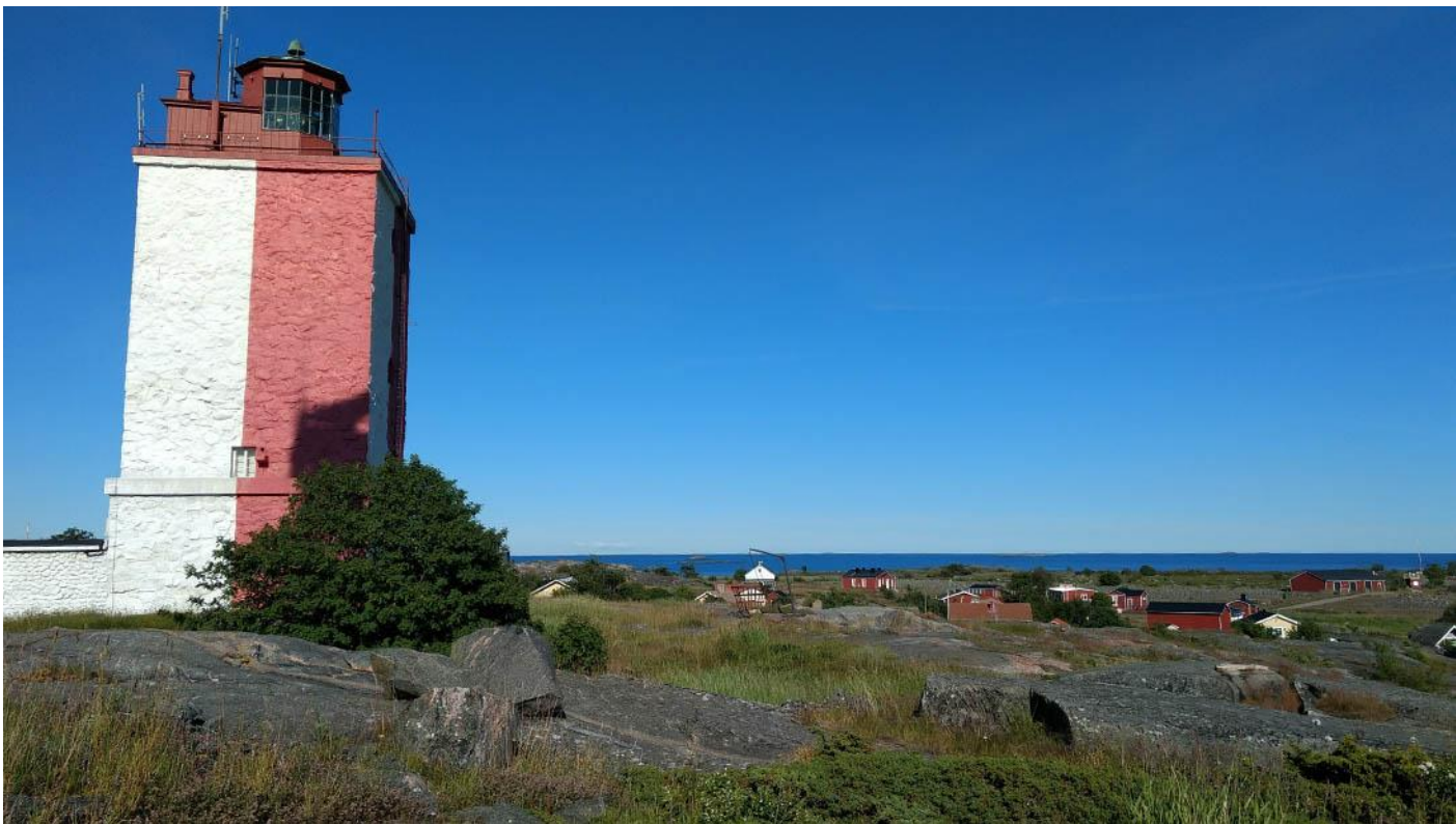
Bilder: Finska Utö