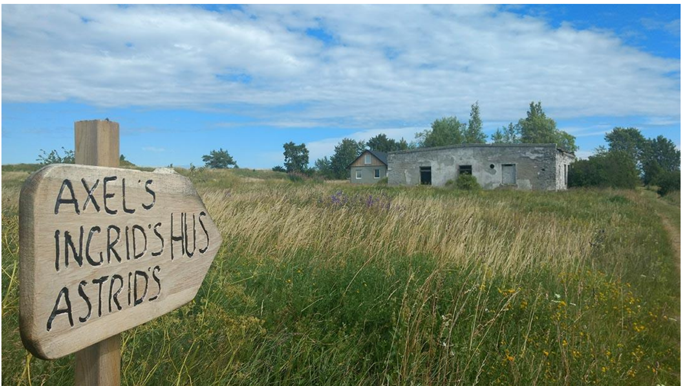
Bilder: Dirhami Estland