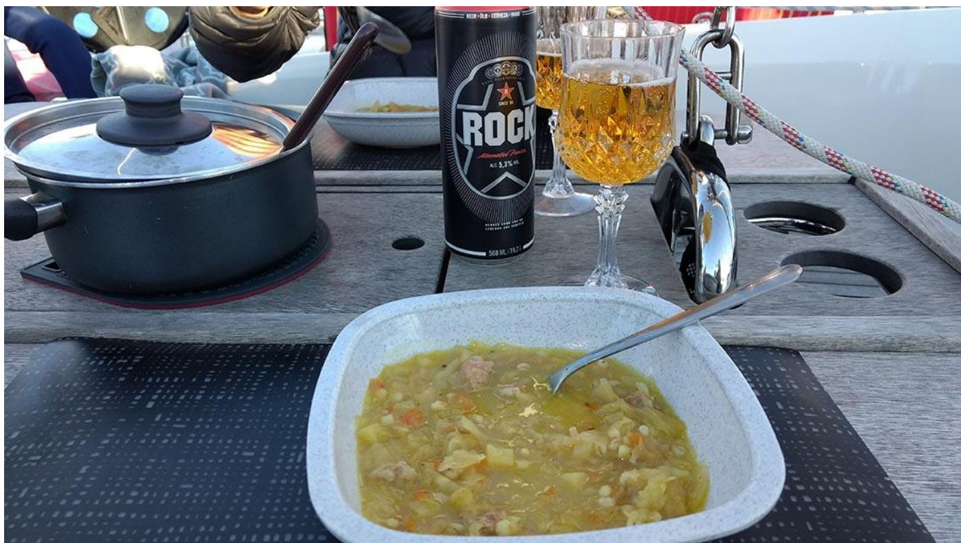
Bilder: Haapsalu Estland