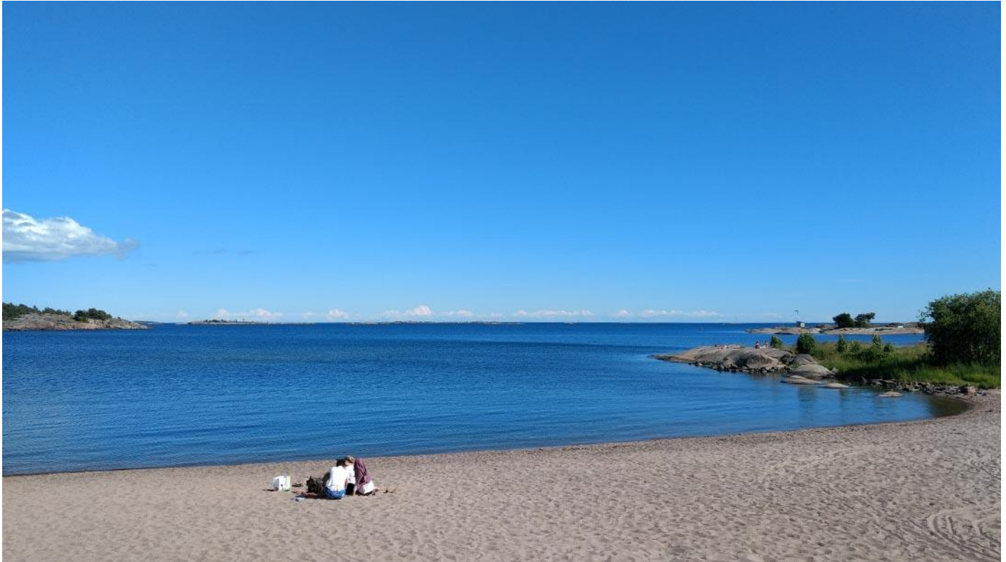
Bild: Hangö Finland

Dags att lämna Estland för denna gång. Raka motvinden igen så det blir motorfärd upp till Hangö. Visst kan man kryssa när man seglar men blåser det hela tiden iskalla nordliga vindar så får även en ivrig seglare som jag nog. Och vi skulle segla en lång sträcka så tiden fanns inte heller, om man inte vill segla hela natten också och det ville vi inte. Men vi hade sol och lä i sittbrunnen så vi överlevde detta med. I Hangö kunde vi storhandla och fylla båten med både det ena och det andra.