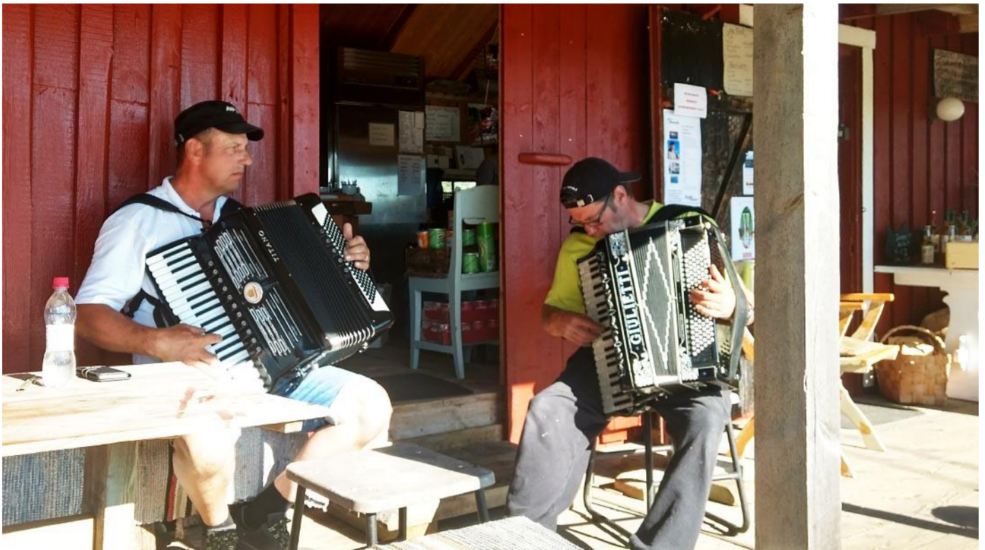
Bilder: Aspö i Åbolands skärgård