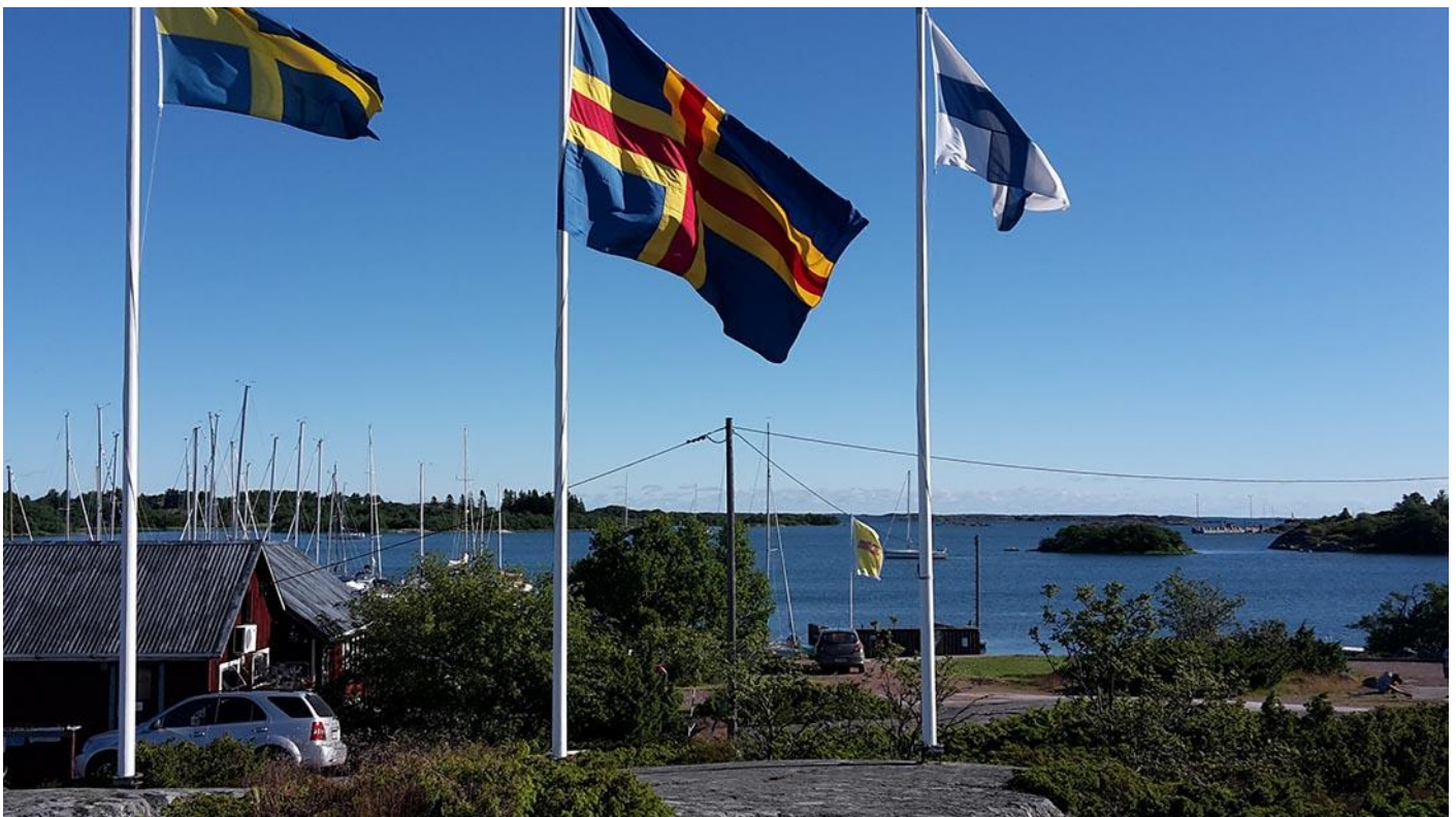
Bilder: Kökar Åland