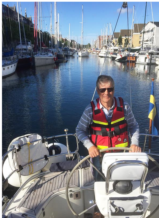
Gästhamnen Wilders Plads Marina i Köpenhamn

Kusligaste händelsen var när vi sedan seglade över till Höllviken och plötsligt upptäcker ett jättestort fartyg lastat med massor av containers 50 meter bakom oss, som vi bara inte hade sett??!! Eftersom hon inte tutade måste de sett att det fanns marginal, men det var läskigt.