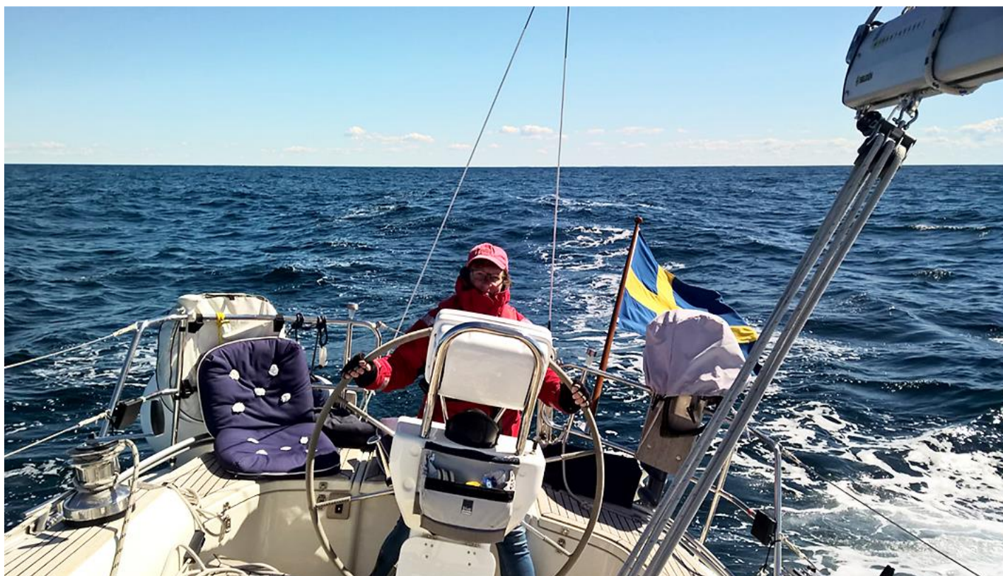
Många sjömil till havs blev det