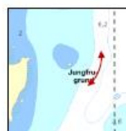
R4: Ost om Jungfru-grund.