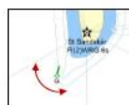
R6: Syd om gröna pricken.