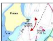
R2: Ost fyren Flaten.