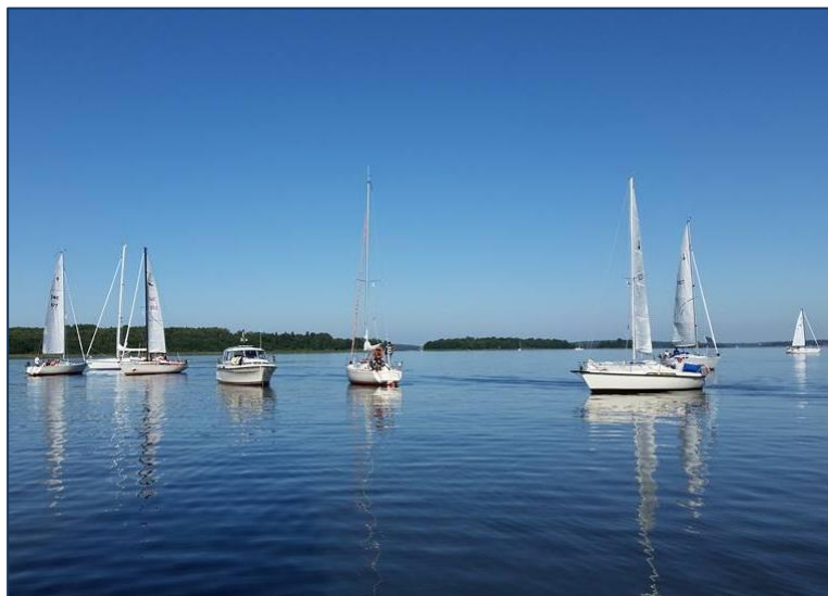
Nästan stiltje. Snart start för Kräftseglingen.