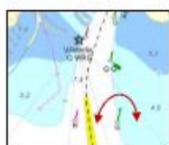
R1: Norr om gröna pricken.