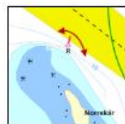
R5: Norr om röda pricken.