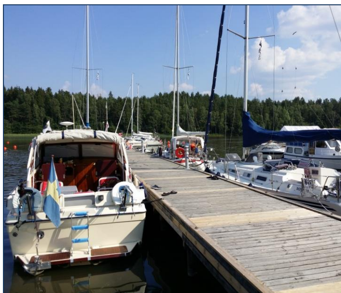
Raka bryggor i Torpstan!