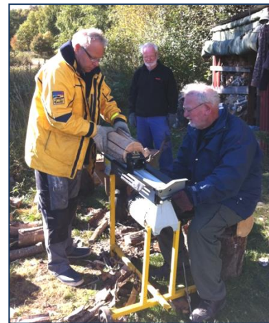
Bilder från höststädningen 2013