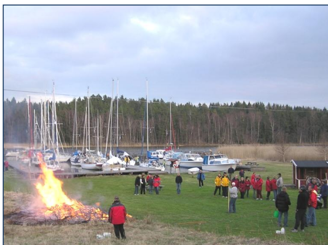
Det är bara 5-6 veckor till valborg. Håll ut, våren kommer!