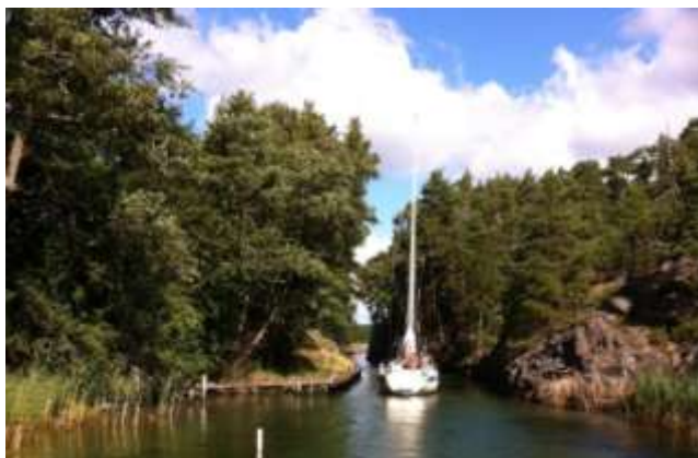
Dragets Kanal.