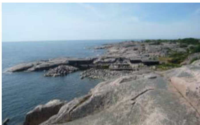
Hamnen på Källskär