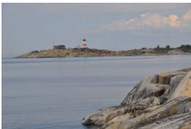
Söderarms fyr sedd från söder