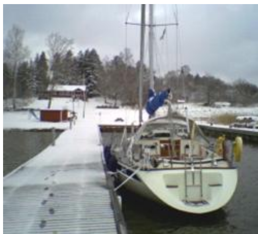
April 2007. Vi hoppas på en varm vår i år!

Först sjunger vi in våren och 7-8 maj rustar vi Torpis för säsongen, två säkra vårtecken! Se sidan 6.