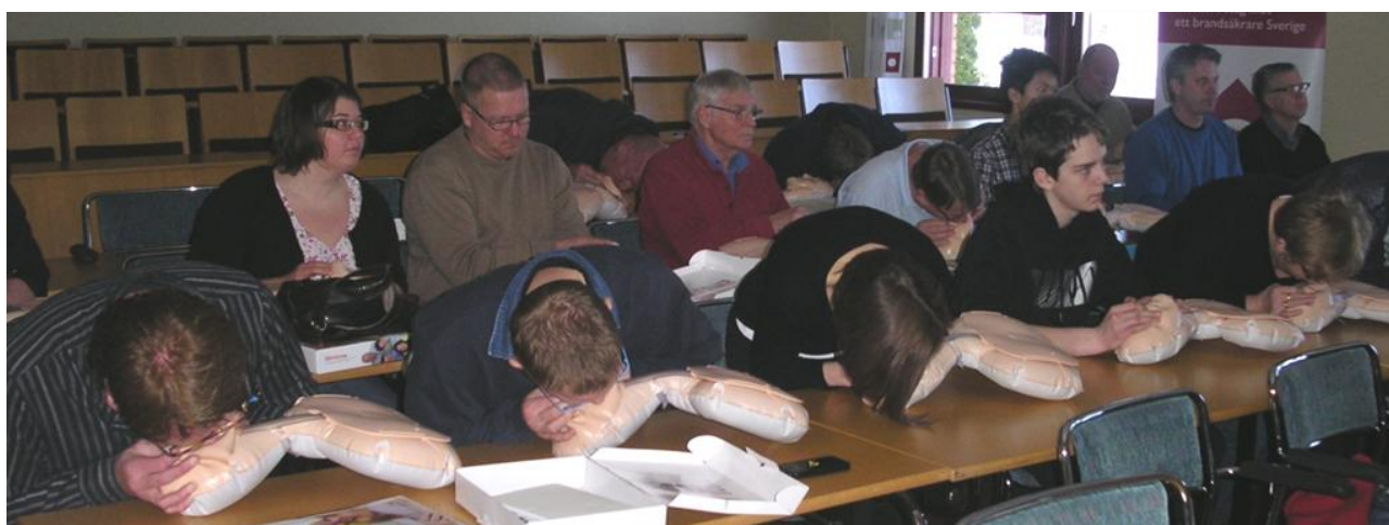
Stilstudie: Hjärt-, lungräddning pågår!