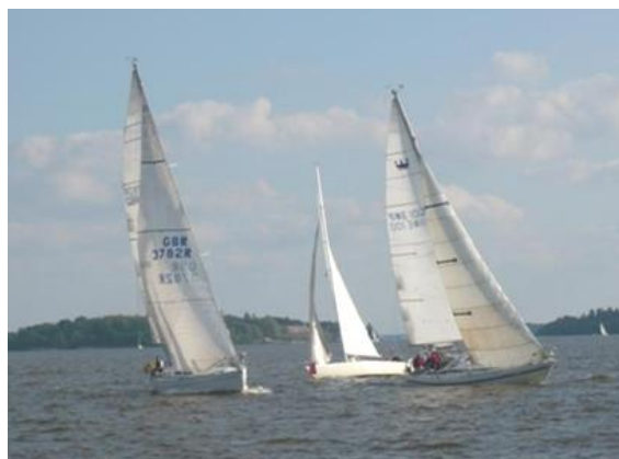
Rundning av märke, BSL:s KM 2009.

Calle Helin calle.helin@tele2.se 070-34 50 123