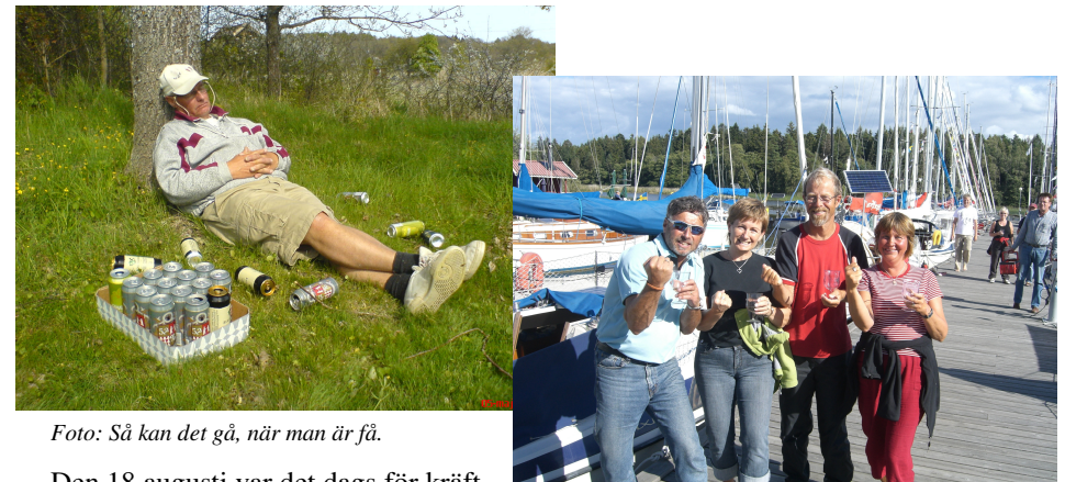
Foto: Så kan det gå, när man är få.